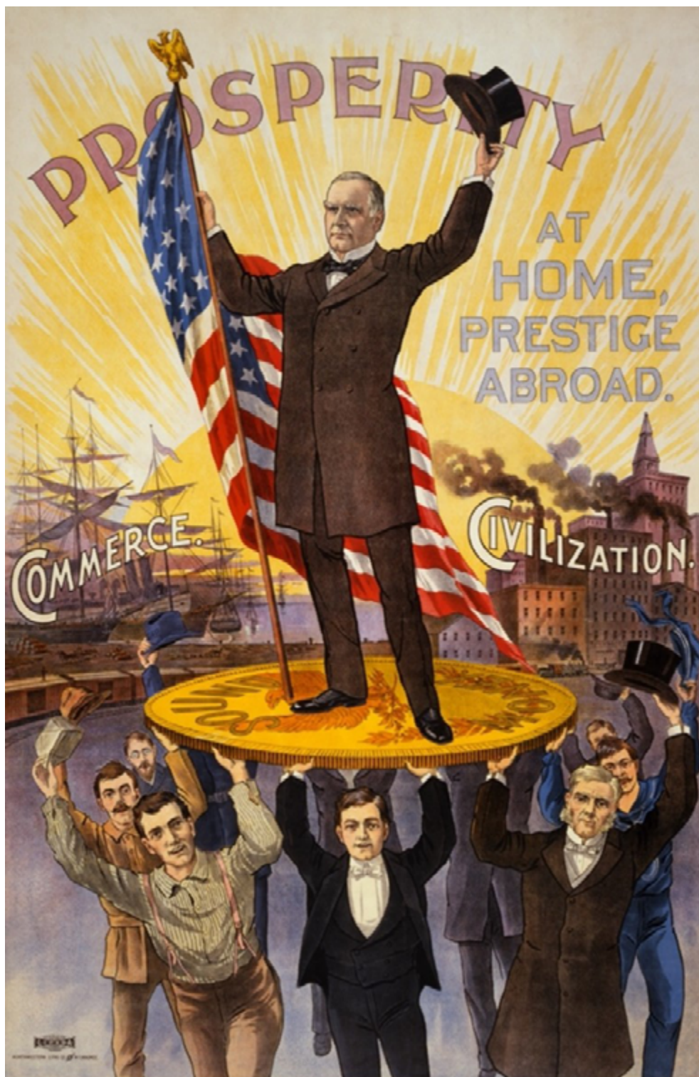
“El Laboratorio Imperial”